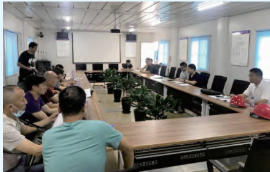
基坑变形协调会议

五、确保全面彻底 1. 周边管线报警情况处理 从地面向地心的挺进过程并不是一路高歌,在进行第三层土方开挖及第三道支撑施工过程中,周边管线陆续超过报警值,加上雨水泛滥,基坑安全将面临非常不利的局面,针对这一情况,项目部第一时间组织设计、业主、施工、监理、管线单位对周边管线情况进行分析,并达成下列处理措施: 1、业主委托专业单位对周边报警管线进行排查,确保管线特别是硬质管线安全无泄漏点。 2、施工单位在土方开挖暴露后,尽快形成支撑及垫层、底板,防止裸土暴露时间长。 3、监测单位加强监测,对于基坑突变的情况第一时间汇报,并采取应急措施。