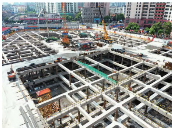
2020.7月第三道支撑完成