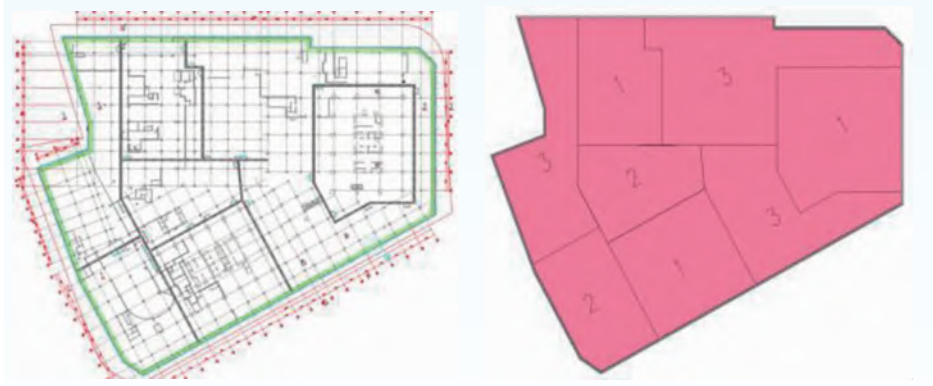
原方案评审时底板后浇带划分

2. 施工技术方案调整 为了确保第四层土方开挖期间的基坑安全,更快地完成基坑收底,减小基坑变形,项目部调整原设计土方开挖方案。 (1)挖土分区的调整 本项目基坑施工组织设计于2019年7月已