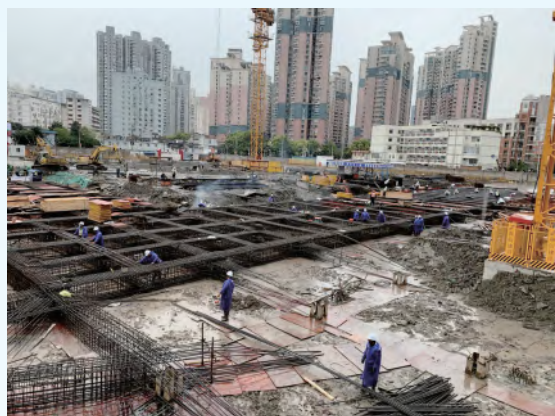
2020.3月首道撑(栈桥)钢筋安装