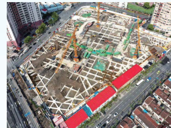
2020.4月第二道支撑土方开挖