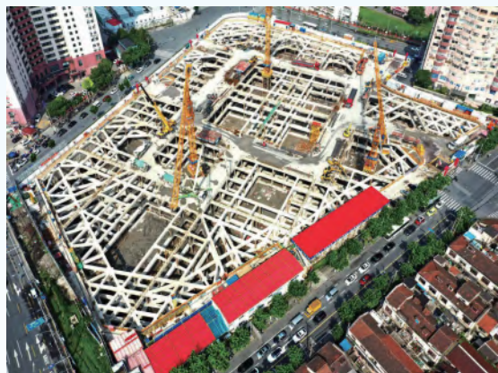
2020.5月第二道支撑完成