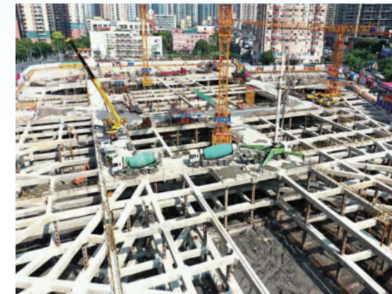
2020.6月第三道支撑土方开挖