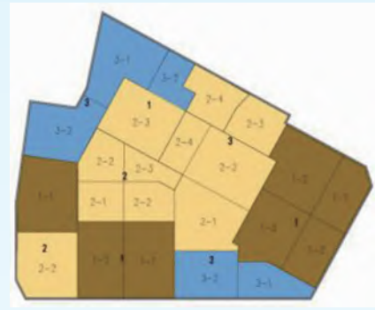
第四层挖土分区顺序图

计最大沉降量已达到19.1mm,逼近报警值20mm,且原建筑沉降缝位置有裂缝(4mm左右),粉刷层有剥落的可能。 为有效控制学校建筑物的变形,也充分利用学校放假这一有利时机,将靠近学校区域的底板划分为第一批底板施工的分块。 在与业主、监理、设计共同协商后,将紧邻学校一侧挖土分块提前开挖,尽快形成支撑,消除隐患,确保学生开学后正常上课。 同时为了减少围护暴露长度,调整原有公平路侧第一区开挖至第二区开挖,分块开挖、分区开挖以控制基坑的整体变形。