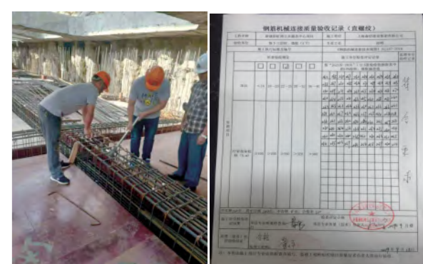
周、月质量检查记录

项目部实行周质量安全检查,月度质量考评制。每周由质量小组和班组进行现场质量检查,针对施工质量发现的问题,分析原因,制定措施,整改落实,复查。每月考评,检查记录通过OA系统上传留痕。