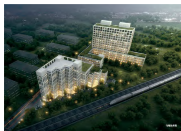
公共服务中心项目部 2019年9月