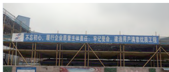
悬挂质量月活动主题标语

有针对性地开展各项质量教育和培训活动:对管理人员的培训以体系文件、质量职责、全面质量管理基础知识、质量标准、规程规范、规章制度等内容为主;对作业人员的培训则以提高现场操作技能、控制工序质量为目的,分工种、分专业进行施工技术、操作工艺、作业指导书等方面的培训。