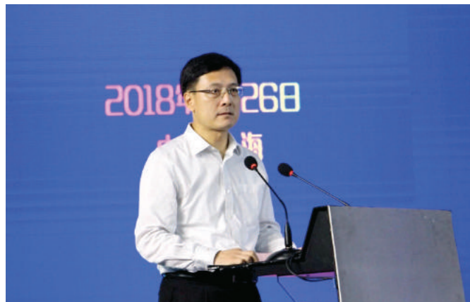
上海市政协副主席李逸平致辞