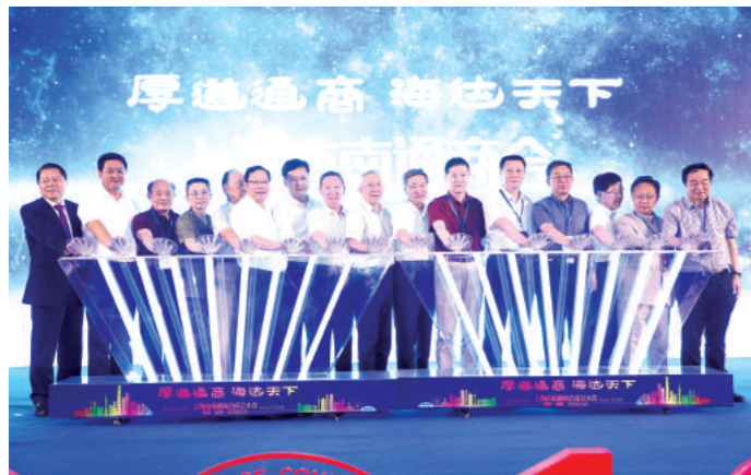
上海市南通商会开启动仪式