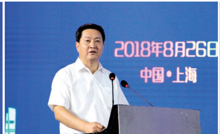
南通市委副书记张兆江致辞