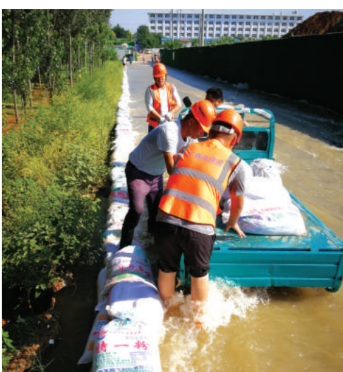
文 / 济南项目部 陈进荣