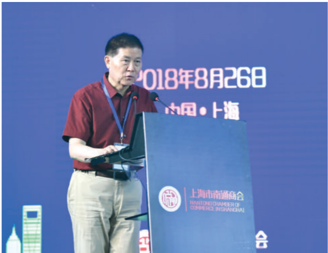
原上海市委常委、警备区政委朱争平致辞